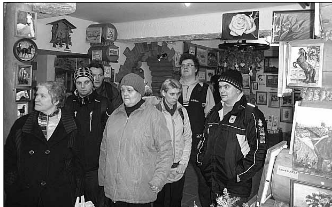
fol. MBP w Wiśle

Miejski Ośrodek Pomocy Społecznej w Wiśle realizuje, w partnerstwie z Powiatowym Centrum Pomocy Rodzinie w Cieszynie, projekt pozakonkursowy pn. „Aktywny powiat cieszyński – program aktywizacji społeczno-zawodowej w obszarze pomocy społecznej”. Projekt ten współfinansowany jest ze środków Europejskiego Funduszu Społecznego w ramach Regionalnego Programu Operacyjnego Województwa Śląskiego na lata 2014–2020.