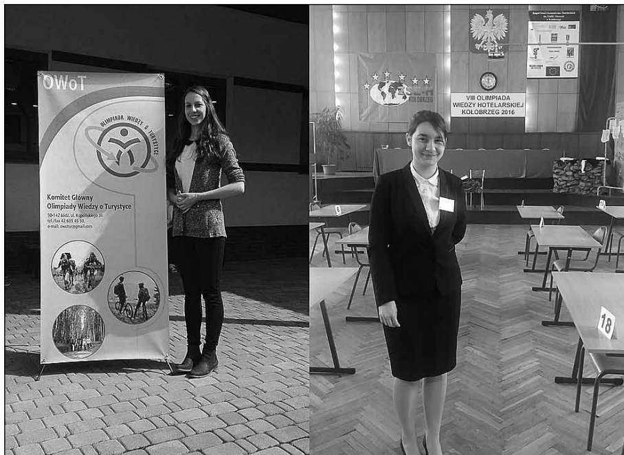
fol. ZSGH im. Reymonta w Wiśle